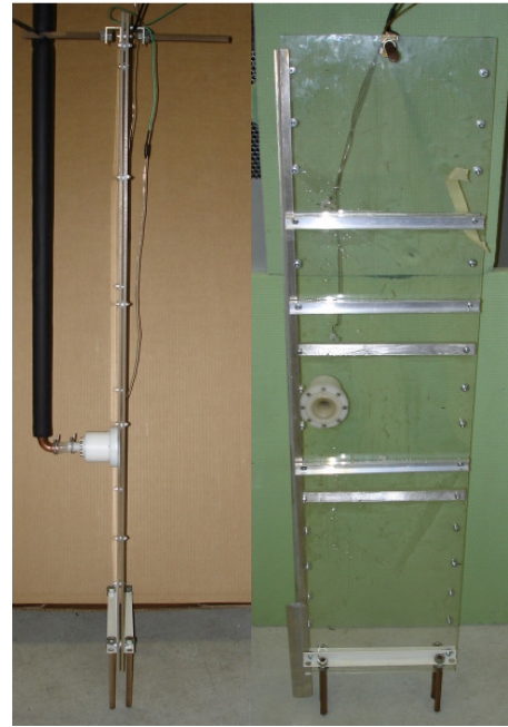
Abb. 1: Am SPF entwickelte Schichtladeeinrichtung aus zwei parallelen Platten.

Plattenabstand zwischen den Platten laminar bis zu der Höhe transportiert, wo die Temperatur derjenigen des umgebenden Speicherwassers entspricht. Aufgrund der Verdrängung durch das nachströmende Wasser erfolgt eine horizontale Einschichtung durch den umgebenden Spalt am Rand der parallelen Platten. Durch die minimale Kontaktfläche zwischen einströmendem Warmwasser und dem Speicherwasser aufgrund der kleinen Spaltbreite zwischen den Platten wird eine ungewollte Durchmischung dieser beiden Wasserphasen im unteren Speicherbereich vermieden.