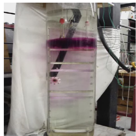
Abb. 4: Resultierende Einschichtung des einströmenden Wassers mit etwa 40 °C.

Je nach vorwiegender Betriebssituation des Speichers und Beladevolumenstrom kann die Spaltbreite variiert werden. Für höhere Volumenströme wäre den Experimenten zufolge eine grössere Spaltbreite vorzusehen, welche den seitlichen Druckverlust verringert und somit verhindert, dass das einströmende warme Wasser in der Beladeeinrichtung zu hoch steigt. Für kleine Volumenströme sollte ein eher kleiner Spalt gewählt werden, der ein Ansaugen und Durchmischen des Speicherwassers mit dem einströmenden Wasser minimiert.