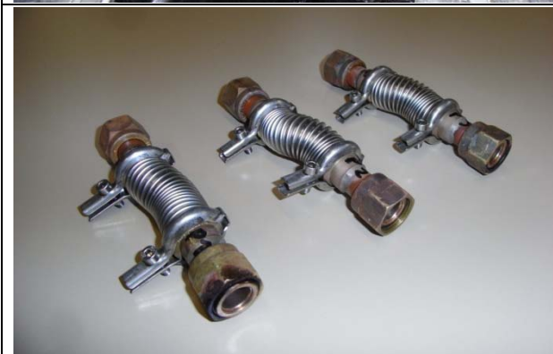
Abb. 4: (Nach dem Test) Trotz den zum Teil erheblichen Deformationen sind alle Teile dicht und unbeschadet.