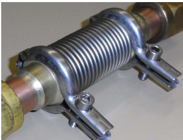
Verbindungssystem mit Kompensator

Anschlusssteile und Verbindungen thermischer Sonnenkollektoren Prüfung nach Vorgaben des Auftraggebers