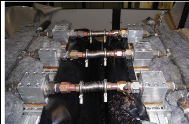
Abb. 3: (Nach dem Test) Alle Kompensatoren sind dicht. Die auf dem Bild sichtbare, ausgetretene Flüssigkeit ist vom Prüfstand und hat keine Bedeutung auf das Prüfergebnis.