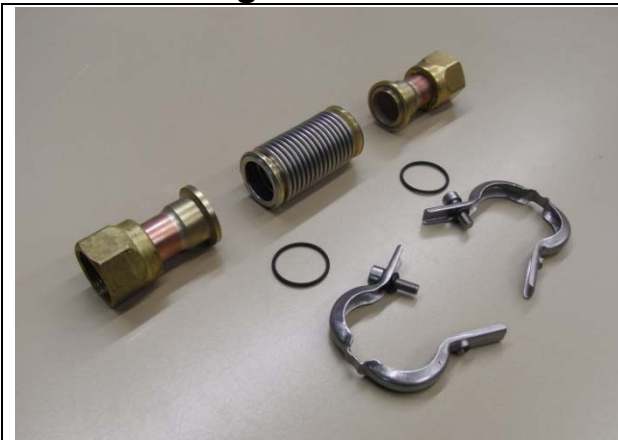
Abb. 1: (Vor dem Test) Verbindungssystem vor der Montage. Die Verschraubung ist Teil der SPF Prüfeinrichtung